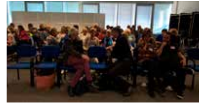
Austausch in „Murmelgruppen“