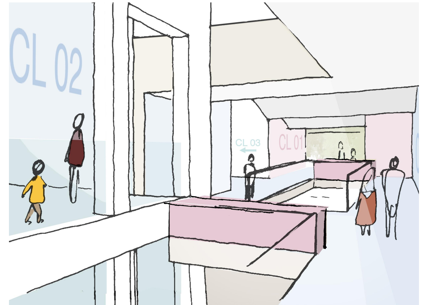
Piktogramm Innenraumnutzungen: Lerncluster