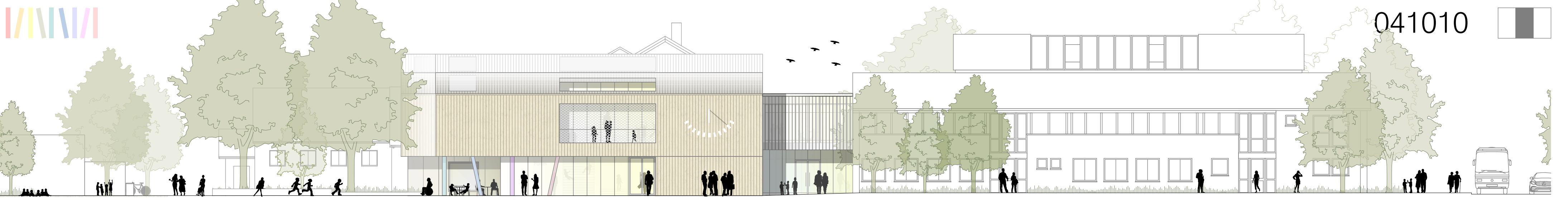
Ansicht West 1:200