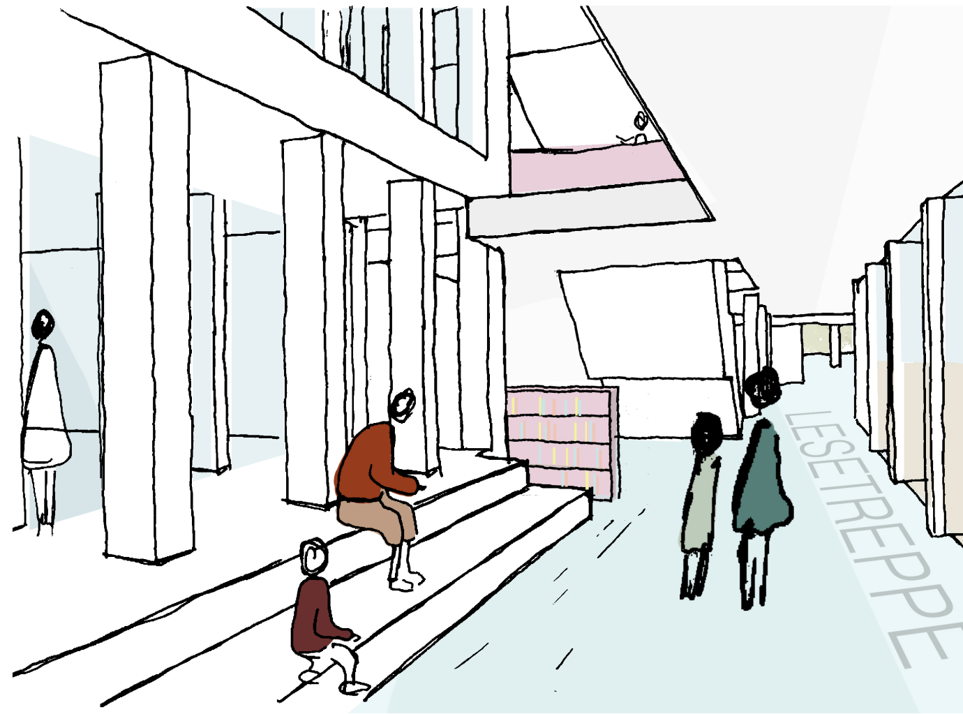
Piktogramm Innenraumnutzungen: Lesesteppe