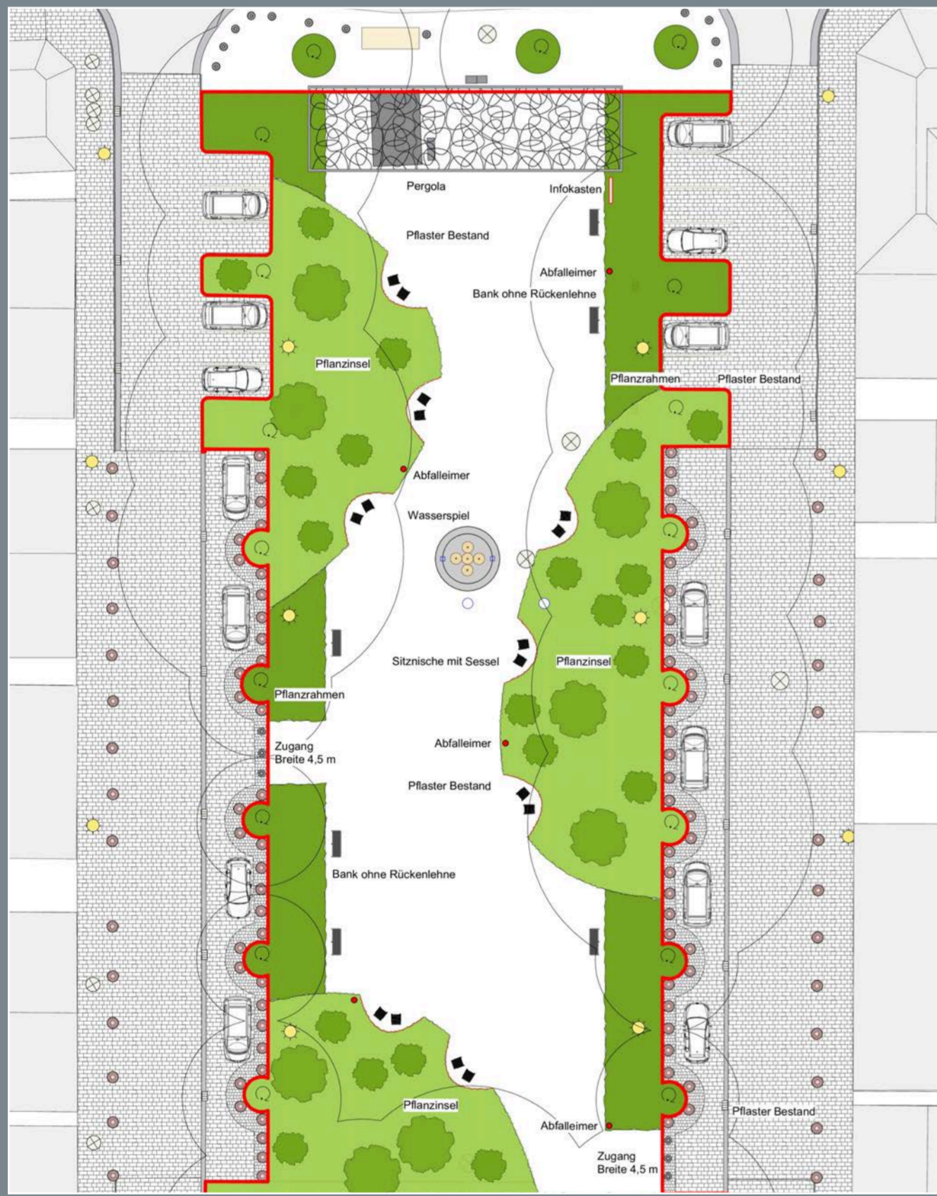
Lageplan Viktoriaplatz, März 2019 WKM Landschaftsarchitekten

Im Zuge der Umbaumaßnahmen wurde neben dem Viktoriaplatz auch der Spielplatz vor der St. Josefs-Kirche neu gestaltet. Auch hier blieb der Baumbestand weitgehend erhalten. In seinen Grundformen und in verschiedenen Ausstattungselementen folgt der Spielplatz der Formensprache des Viktoriaplatzes.