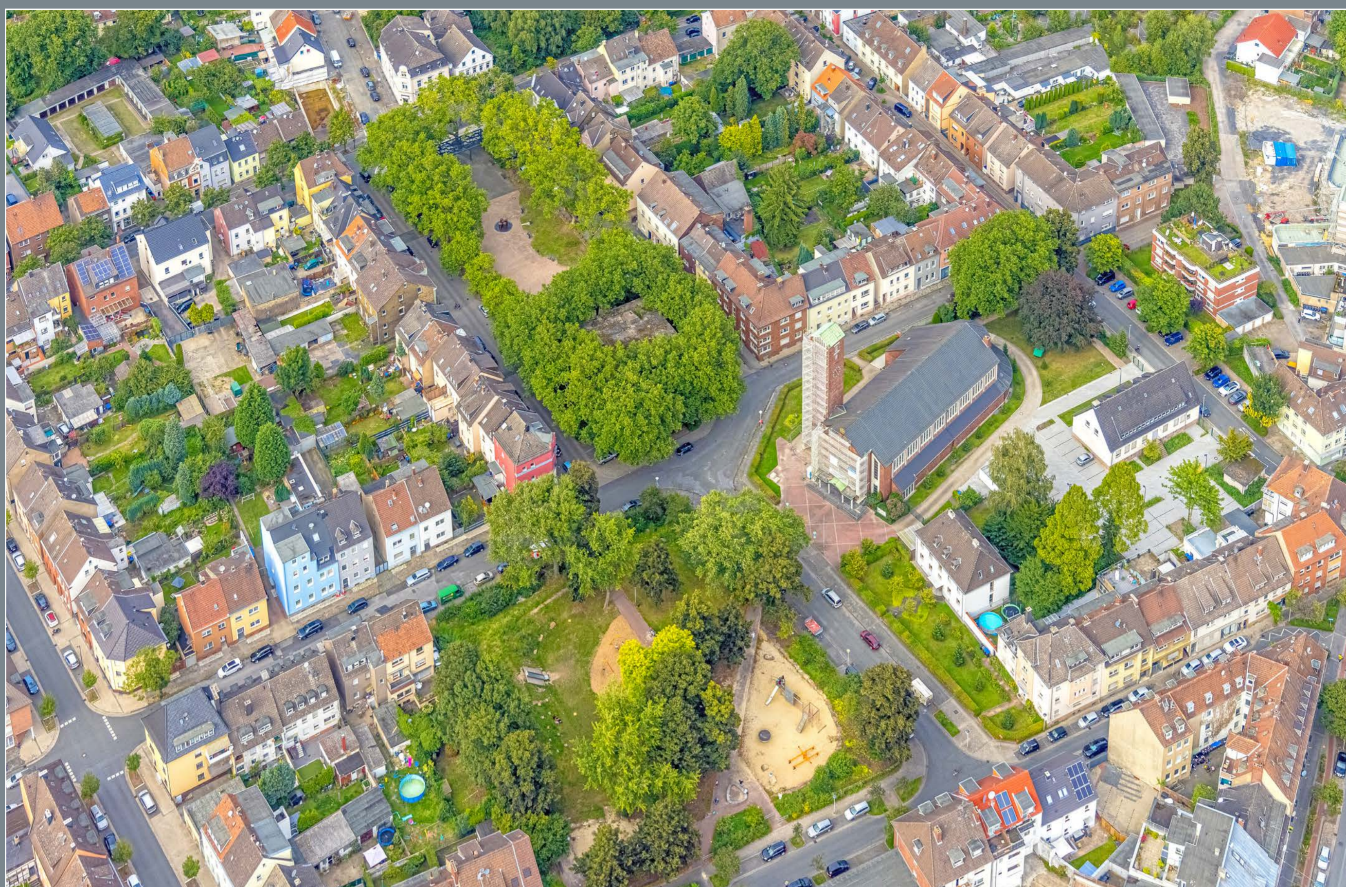
Viktoriaplatz und Spielplatz vor der St. Josefs-Kirche nach Umbau, August 2021 | Hans Blosser