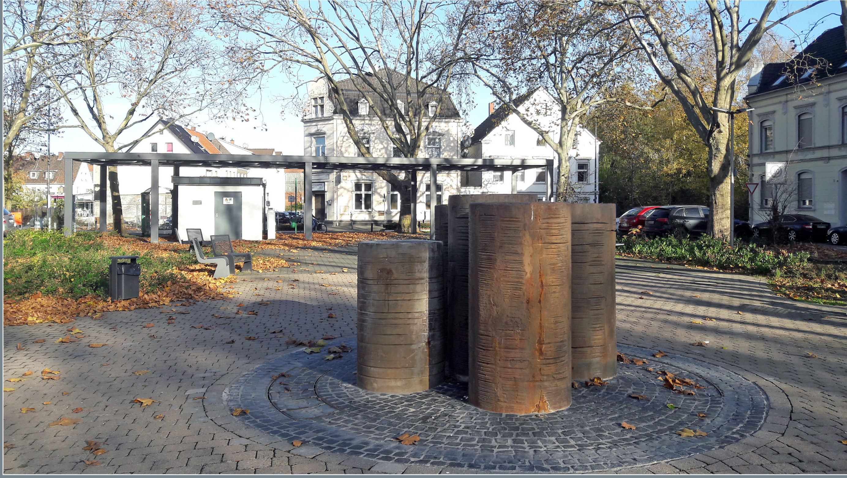
Umgebaute Brunnenanlage mit integrierten Walzenelementen | Stadt Hamm