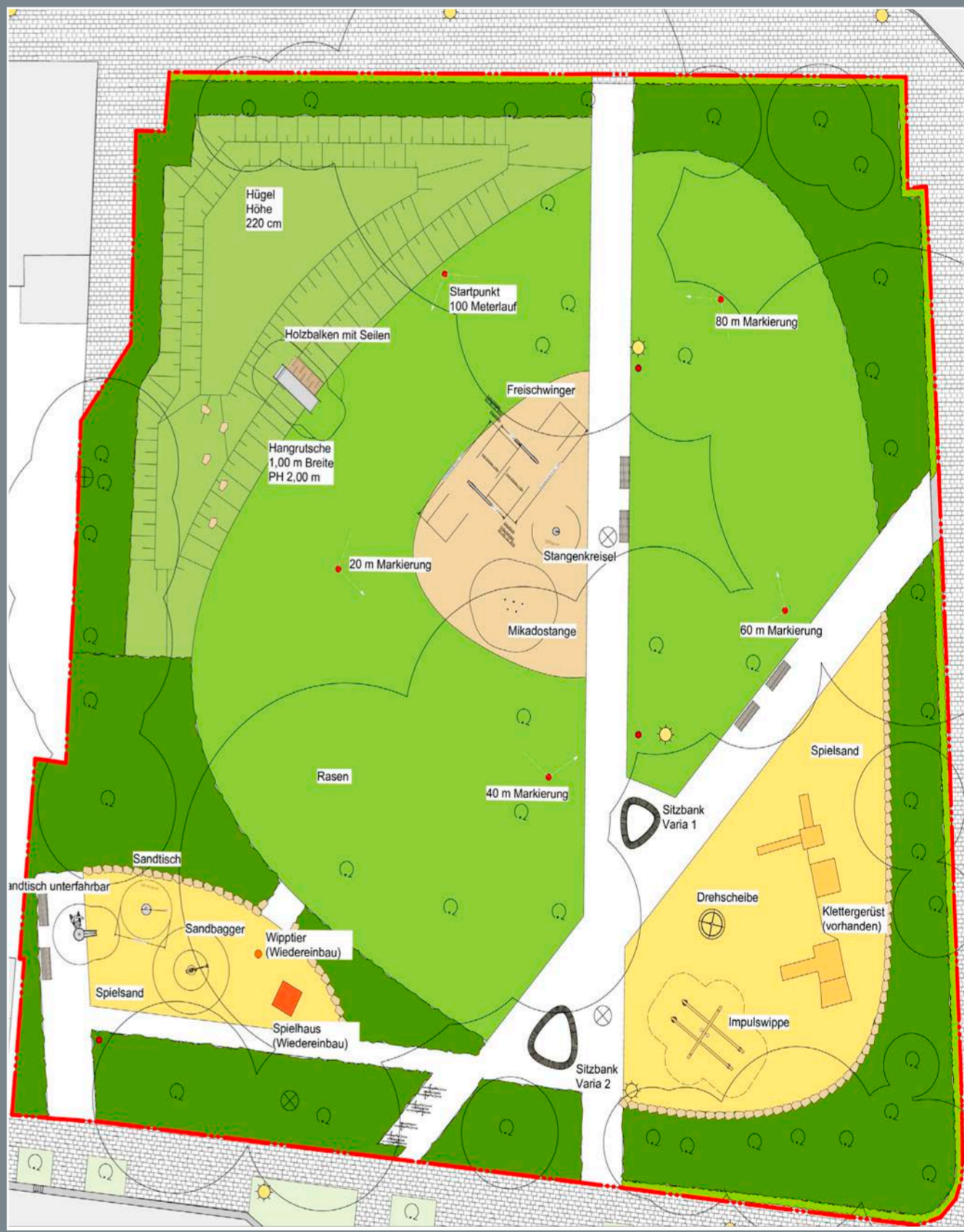
Lageplan Spielplatz Steinstraße, März 2019 WKM Landschaftsarchitekten