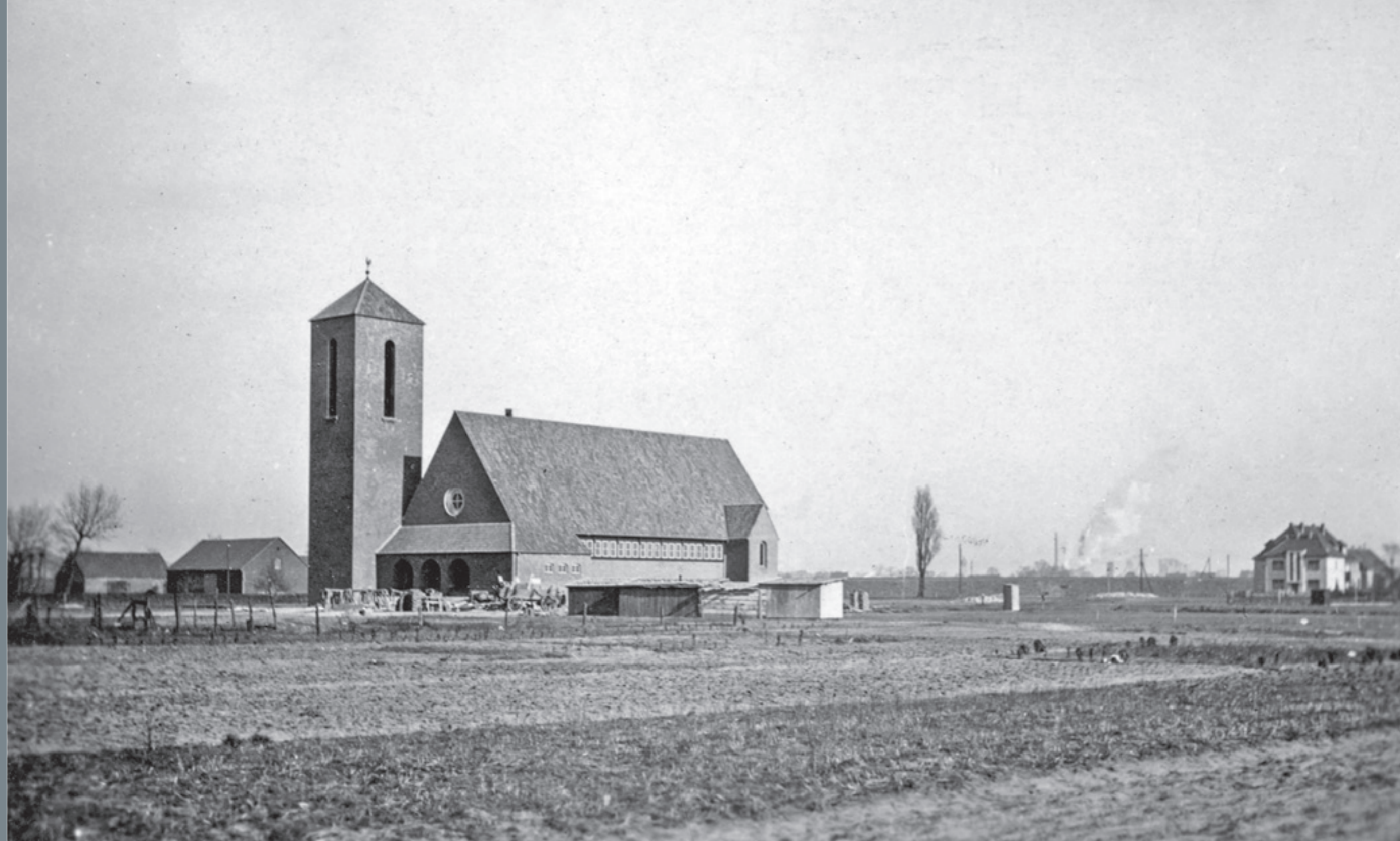
Der 1938 fertiggestellte Neubau der Johanneskirche in der Nordenfeldmark, links davon der Hof Freisfeld, im Hintergrund rechts Bebauung am Landwehrweg