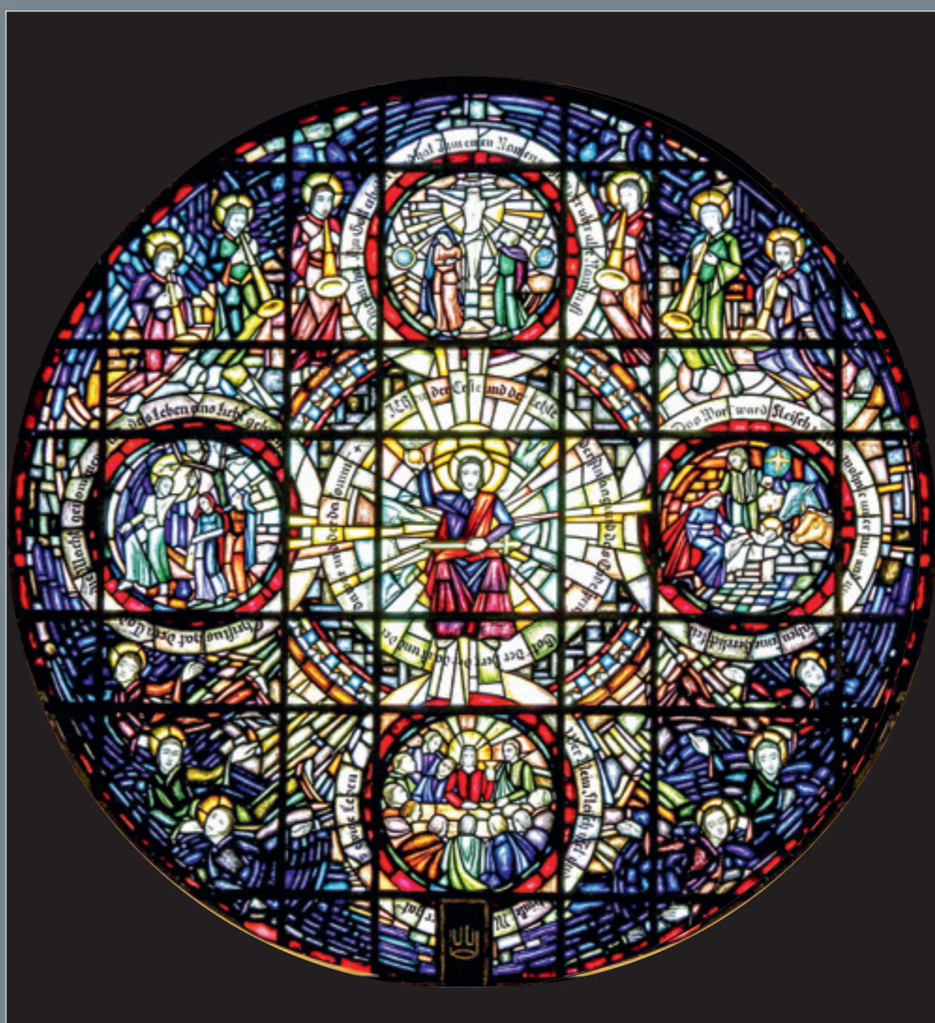
Die in der Hagener „Glaswerkstätte Haspe, Heberle & Co.“ gefertigte Buntfensterrose der bedeutenden expressionistischen Künstlerin Elisabeth Coester (1900–1941) überstand – dank rechtzeitiger Auslagerung – den Zweiten Weltkrieg und wurde 1999 aufwändig restauriert.