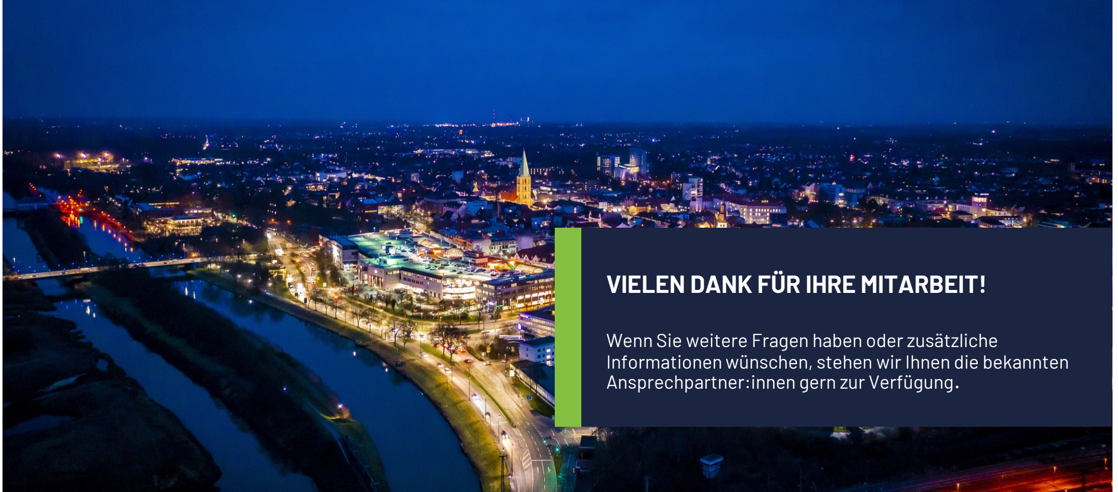
Hamm Panorama