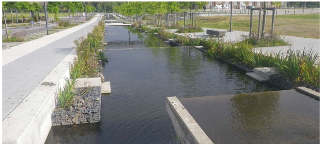
Abbildung 2: Oberflächige Niederschlagswasserableitung im Gebiet PHOENIX-West

Freiräume nicht vorhanden. Auch bedingen diese eine Veränderung des Kanalisationsnetzes, das sukzessive Einführen von Trennsystemen und die Ausrichtung von Kanälen und Ableitungsrinnen in Richtung der besagten Grün- und Wasserachsen. Der Anpassungsdruck wird sich aber durch die Klimaveränderung und deren Folgen, wie vor allem die Zunahme von Starkregenereignissen und einen Temperaturanstieg in den Sommermonaten, durch wirtschaftliche Erwägungen sowie das Bestreben eines nachhaltigen Umgangs mit Niederschlagswasser weiter verstärken. Insoweit ist es angezeigt, nicht zuletzt in Anbetracht künftigen erheblichen Investitionen in die Abwasserinfrastruktur und insbesondere zur Kanalsanierung die Veränderung der Siedlungsentwässerung vor allem im Bereich der Bauleitplanung zu berücksichtigen bzw. voranzutreiben.