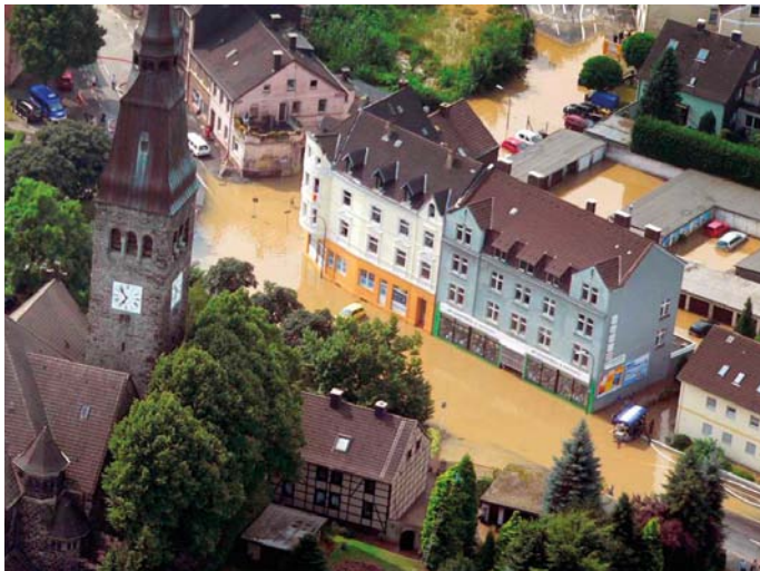
Abbildung 1: Starkregenereignis mit Niederschlagsmengen von über 200 mm innerhalb von 2 Stunden

Seit geraumer Zeit häufen sich in Dortmund und andernorts Starkregenereignisse. Sie haben wiederholt und zum Teil schwere Überschwemmungen und Sachschäden verursacht. Diese Schadensereignisse führen immer wieder vor Augen, wie empfindlich Siedlungsgebiete gegenüber Starkregenereignissen und ihren Folgen sind (siehe Abbildung 1: Überflutung am 26.07.2008). Unter den einschlägigen Fachleuten aus Wissenschaft und Forschung ist es weitgehend unumstritten, dass sich durch die Erwärmung der Atmosphäre das Potential für derartige Extremwetterereignisse erhöht.