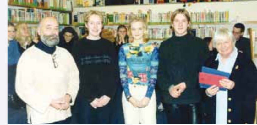
Preisverleihung 1. Schreibwettbewerb 1999 / 2000