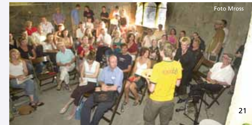
1. Poetry Slam 2005

Ab September 2009 wird das Projekt eines originären Hammer Poetry Slams schließlich aufgegeben – an seine Stelle tritt ein regelmäßiger Poetry Slam, der parallel in mehreren westfälischen Städten (darunter auch in Hamm) organisiert wird, bei dem zumindest semi-professionelle Slammer auftreten.