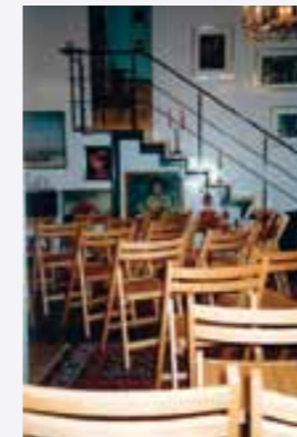
Bücher-City Ost 2012