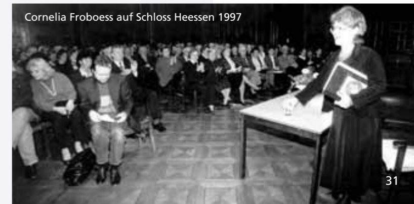
Cornelia Froboess auf Schloss Heessen 1997