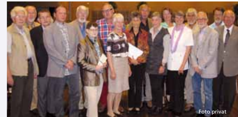
Mein Hermann Hesse 2012