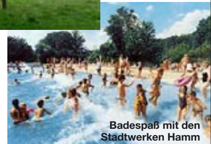
Badespaß mit den Stadtwerken Hamm