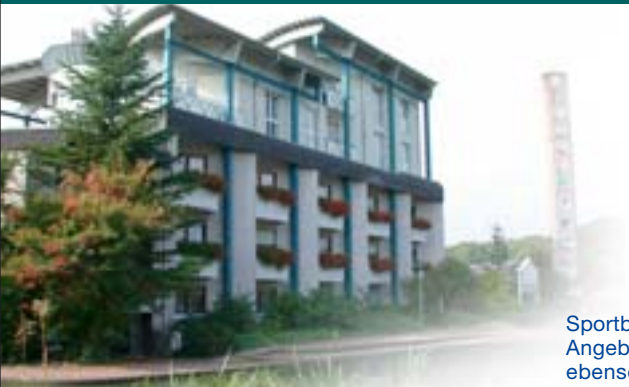
Hotel und Restauration im Selbachpark